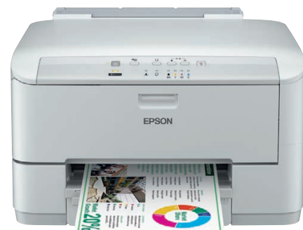
Modello WP-4015 DN