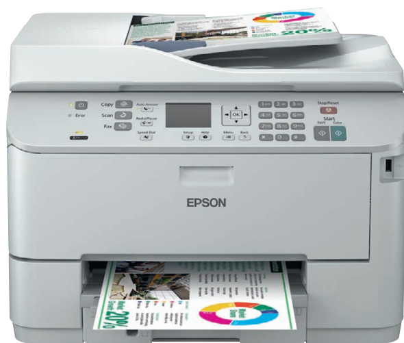
Modello WP-4525 DNF 7

Tutti sappiamo quanto sia inefficiente dover aspettare le stampe, specie se si tratta solo di poche pagine. Ecco perché Epson ha creato la serie di stampanti e multifunzione WorkForce Pro WP-4000 e WP-4500.